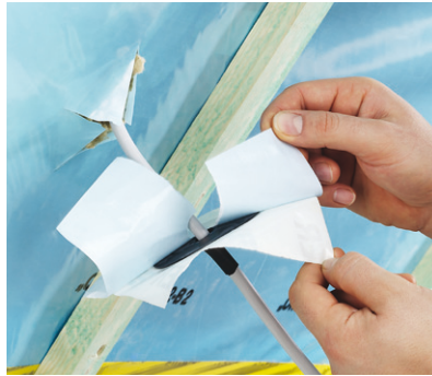
Beschermfolie van de manchet aftrekken.