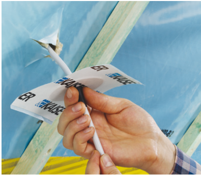
Manchet over de kabel of de buis schuiven.